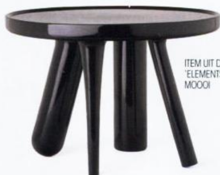
ITEM UIT DE SERIE 'ELEMENTS' VOOR MOOOI