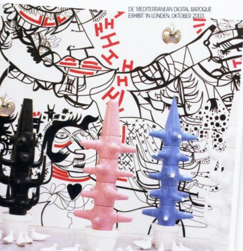
DE 'MEDITERRANEAN DIGITAL BAROQUE' EXHIBIT IN LONDEN, OKTOBER 2003

Hayon combineert design, mode, kunst en architectuur als geen ander