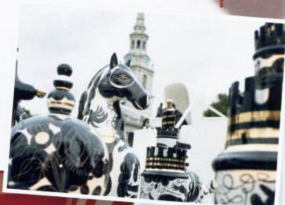
2009 LONDON DESIGN WEEK 'THE TOUR- NAMENT' OP TRAFALGAR SQUARE