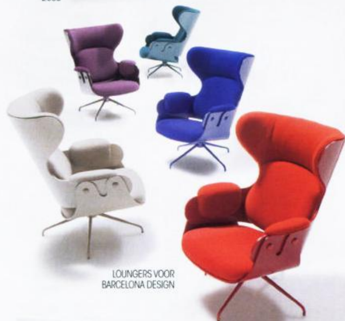
LOUNGERS VOOR BARCELONA DESIGN