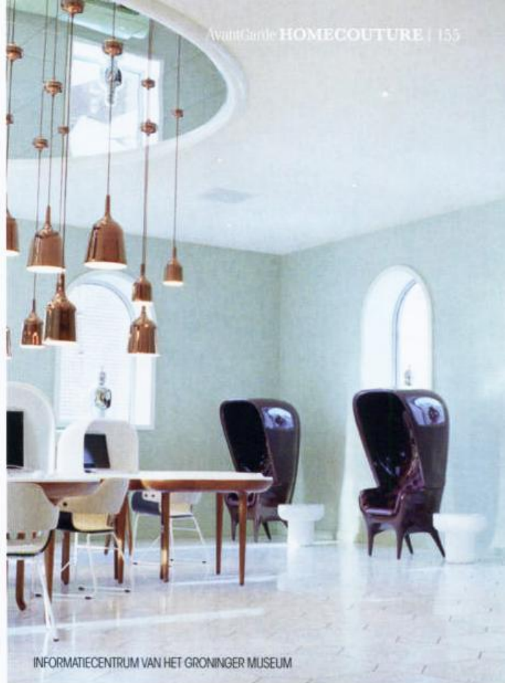
INFORMATIECENTRUM VAN HET GRONINGER MUSEUM

Het gaat er volgens Hayon om dat je de horizon probeert te verbreden en deuren opent voor nieuwe dingen. "Mensen moeten dichterbij elkaar komen en design kan hiervoor zorgen. Dingen creëren waar je hart en ziel in zitten, dat is het enige wat de mensen ervoor hoeven te doen. Maar de wereld verandert en iedereen is met iets anders bezig." Jaime is van mening dat zolang je diversiteit blijft toepassen in je werk, je succesvol kunt blijven: "Ik heb al zoveel verschillende dingen ontworpen, maar uitdagingen moet je gewoon durven aangaan, anders blijf je op één punt en ga je vastzitten." Dat hij goed bezig is, is inmiddels bevestigd met diverse awards. In 2006 won hij de prijs Best Design namens het magazine Elle Deco . Verder werd hij gevraagd als eregast voor de Belgische Interieur Biënnale en daarmee was hij de jongste eregast ooit. In Nederland is zijn werk te zien in het Groninger Museum; hij ontwierp er het informatiecentrum. Op dit moment lopen er veel projecten. Jaime Hayon staat bruisend in het leven en hij is van plan om in de toekomst nog veel meer te laten zien. In welke vorm we zijn werk tegen zullen komen? Dat weet je maar nooit. Maar we weten wel dat we niet kunnen wachten tot de volgende verrassing. ❖