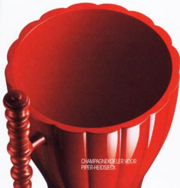
CHAMPAGNEKOELER VOOR PIPER-HEIDSIECK