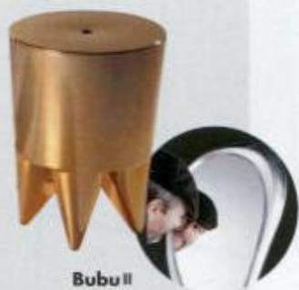
Bubu II design by Philippe Starck