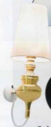
Tudor' chairs, Showtime Mirror, & Josephine design by Jaime Hayon