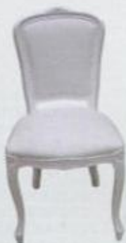
New Classic Series product of SIXINCH