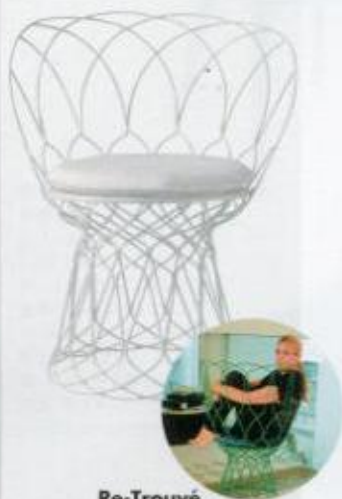
Re-Trouvé design by Patricia Urquiola

ハイメ・アジジョン、パトリシア・ウルキオラなど、トレンドデザイナーのプロダクツが溢れる空間で フード、ファッション、ビューティー、インテリアと多彩なライフスタイルや 世界ではここだけのレアなファニチャーも実感できる、ELLEの世界をぜひお楽しみください。 オンラインでELLE CAFÉメールマガジンにご登録すれば、最新ニュースもGETできます！