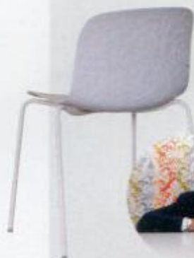
Troy design by Marcel Wanders